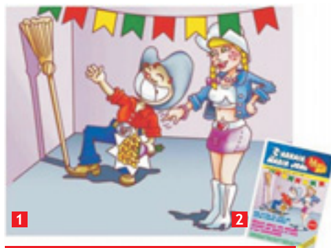
Ilustração 3° Arraiá Bar Maria João