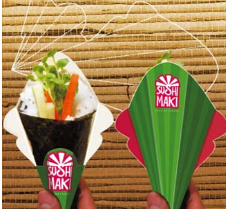
Embalagem Temaki SushiMaki Cliente: Grandesign Projeto Produto-Gráfico, Finalização Ano: 2007