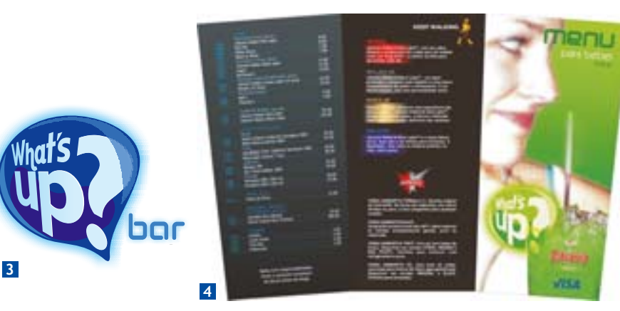
Logotipo e Material Impresso What's Up? Cliente: Grandesign 1. Cardápio Petisco (2 dobras); 2. Convite Inauguração; 3. Logotipo; 4. Cardápio Bebidas Ano: 2005