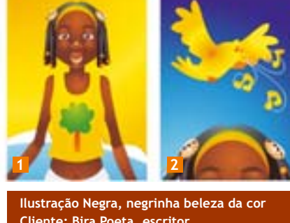
Ilustração Negra, negrinha beleza da cor Cliente: Bira Poeta, escritor 1. Nana; 2. O canto do canário Ano: 2006

Concordo, mas não tem algo mais? De fato, quando tive total confiança e colaboração de alguns clientes obtive também os melhores resultados.