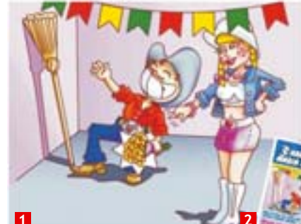
Ilustração 3* Arraiá Bar Maria João Cliente: Grandesign 1. É impossível ficar sem par; 2. Panfleto Ano: 2005

limites da criatividade e da investigação para seguir a via mais conveniente entre o ideal e o real, superando as adversidades. Amadureci muito em dez anos de atividades que sedimentaram minha experiência e hoje me sinto com potencial suficiente para fazer diferente em grandes corporações. Minha meta é lutar por isto, pregar o design e conquistar meu espaço além dos mares da Bahia.