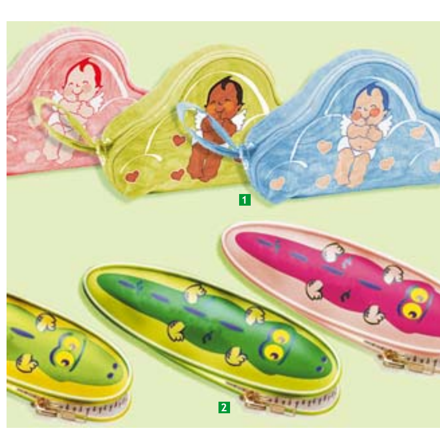
Estojo Kit Dental Cliente: LPM Brindes Design Anjo na nuvem para 0-4 anos, ambos os sexos; jacaré 4-8 anos, ambos os sexos Ano: 2006