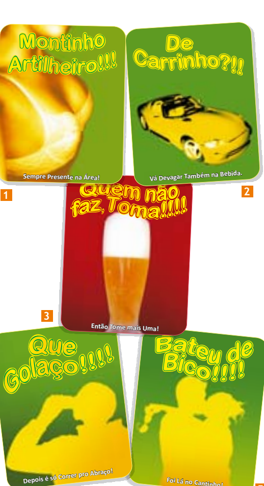
Cartazes e Campanha Copa de 2006 Bar Caminho de Casa Cliente: Grandesign 1. Montinho artilheiro!!! Sempre presente na área!; 2. De carrinho?!!? Vá devagar também na bebida.; 3. Quem não faz, toma!!! Então tome mais uma!; 4. Que golaço!!!! Depois é só correr pro abraço!; 5. Bateu de bico!!!! Foi lá no cantinho! Ano: 2006

Você acaba de conhecer um pouco sobre o designer Tiago Torres. Vale à pena acessar o blog na internet onde está disponível seu portfólio, currículo e ilustrações. Deixe sua mensagem, faça um comentário, entre em contato. ■